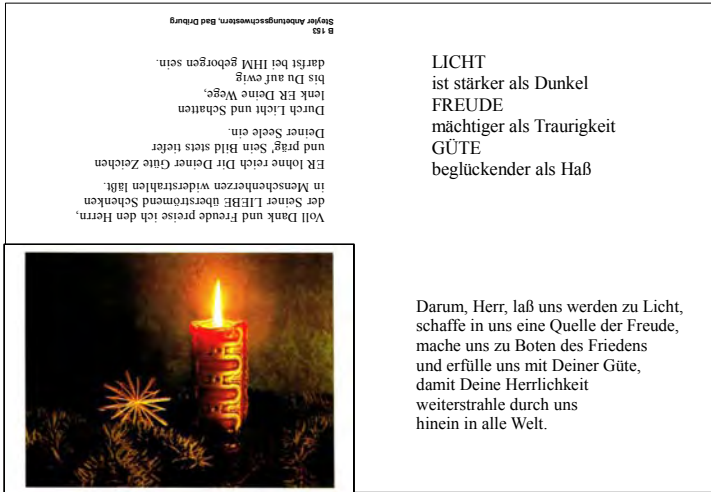
Bild - Gebetszettel